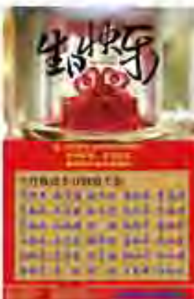
李晚 / 综合办公室