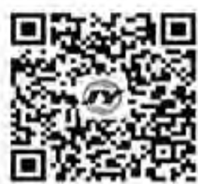
集团公司公众微信账号