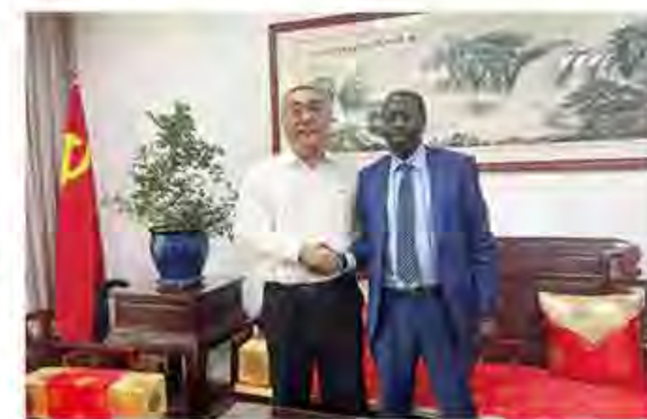
(图为董事长与肯尼亚巴林戈郡郡长本杰明·切塞尔·切博伊合影)

持续强化硅藻土矿投资项目，深度挖掘潜在投资价值，引领投资项目产业链优化。巴林戈郡将加大对集团投资项目的支持力度，加强政策扶持和服务保障，与企业携手推动中肯两国在硅藻土领域的深度合作，实现双方共同繁荣与发展。